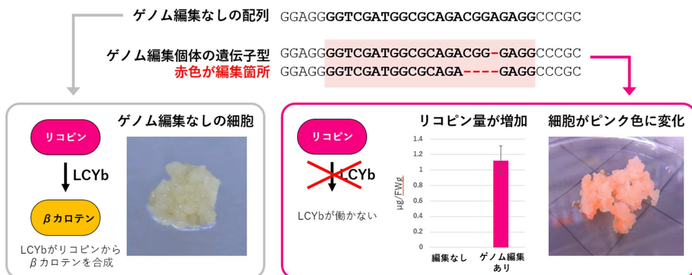
図1 ウイスキー超音波 RNP 法を使用して作製したイネ LCYB 変異体とその色素沈着の様子

次に、ウイスキー超音波 RNP 法が今までゲノム編集が試みられていない遺伝子においても適用可能かを調べるために、 カロテノイド合成系遺伝子 であるイネ LCYB 遺伝子のゲノム編集による破壊を実施しました (図1)。ウイスキー超音波 RNP 法を用いて、RNP および薬剤耐性遺伝子発現プラスミド DNA を同時に導入した細胞では、ゲノム編集が見られるとともに、リコピンの蓄積量が増え、赤色の色素が沈着していることがわかりました。本結果は、イネ LCYB 遺伝子がゲノム編集により破壊された場合に、イネでリコピンが蓄積することを示した初めての例になります。イネ LCYB 遺伝子は、リコピンから \beta カロテンを合成する際に必要な遺伝子と考えられており、その実証ができたと言えます。