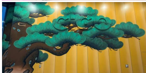
協力:独立行政法人日本芸術文化振興会(国立劇場)