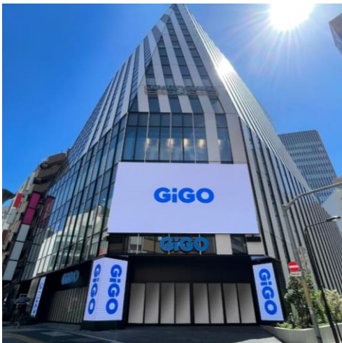
デジタルサイネージ&メインエントランス

店内2階には創業130年の『金井大道具』による歌舞伎の舞台美術「松羽目」が国立劇場と同じサイズで忠実に再現されており、その圧倒的な存在感と、筆の質感まで感じられる再現性で、普段は立つことのできない舞台を体験することができます。外観に設置した6面のデジタルサイネージはそれぞれが連動することでサンシャイン60通りに新しいビジュアルエンターテインメントを提供しています。