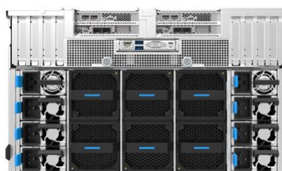
当社が取り扱う NVIDIA 製 GPU 搭載高性能サーバー