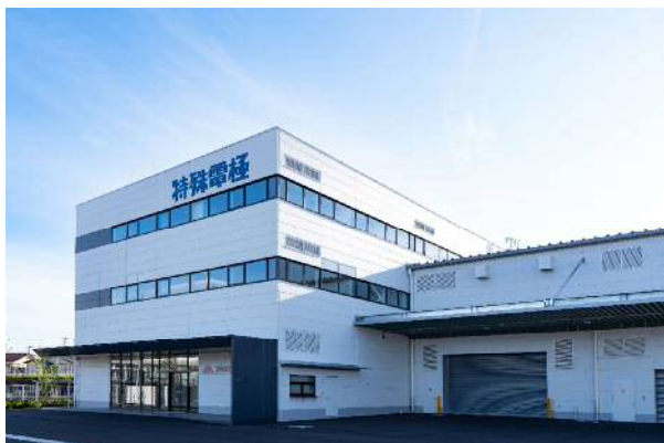
新本店(本社・本社工場)外観

定款上の本店所在地につきましては、2023年6月28日開催の第76回定時株主総会において、「定款一部変更の件」を付議し、定款に定める本店所在地を兵庫県尼崎市から兵庫県加古川市に変更することにつき、ご承認を頂いております。なお、本日の決議により、本店移転日の2024年1月1日をもって本店の所在地変更の効力が発生いたします。