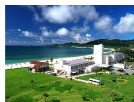
久米島 イーフビーチホテル