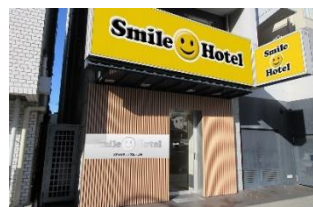
スマイルホテル大阪天王寺 (本投資法人保有物件)