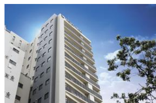
ホテルウィングインターナショナル セレクト上野・御徒町 (本投資法人保有物件)