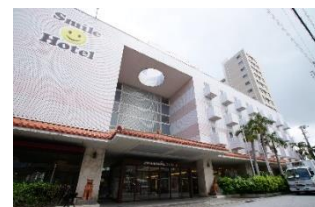
スマイルホテル那覇シティリゾート (本投資法人保有物件)