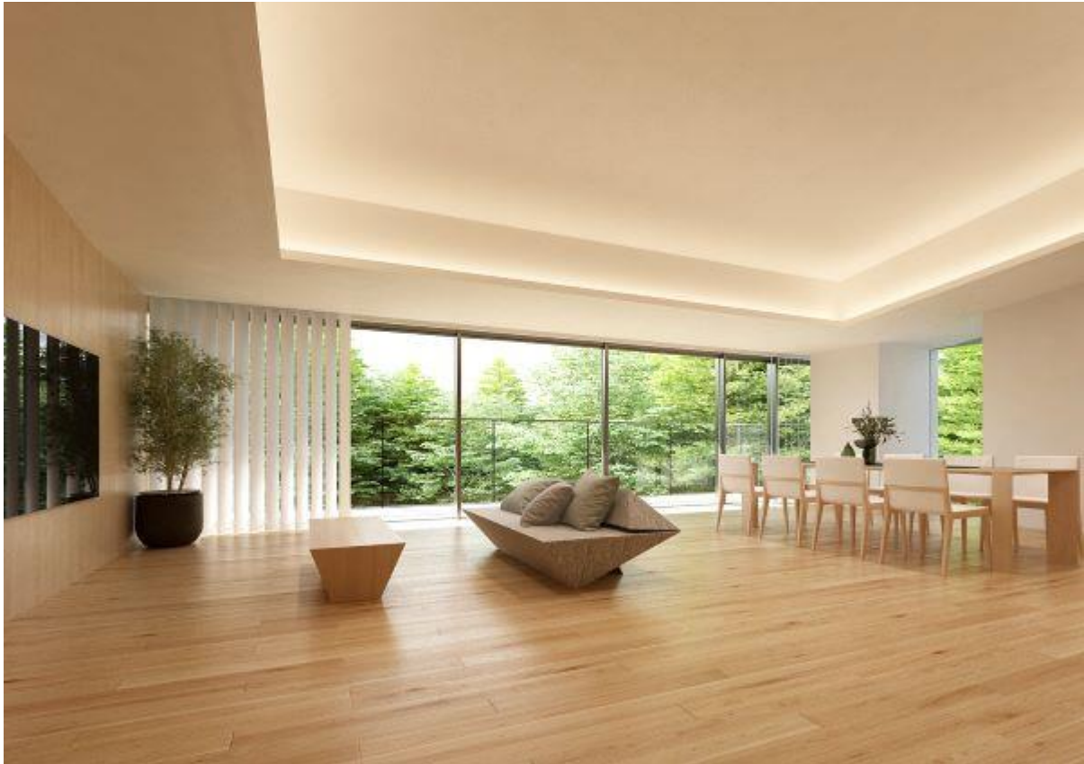
【Room Type 木目調】