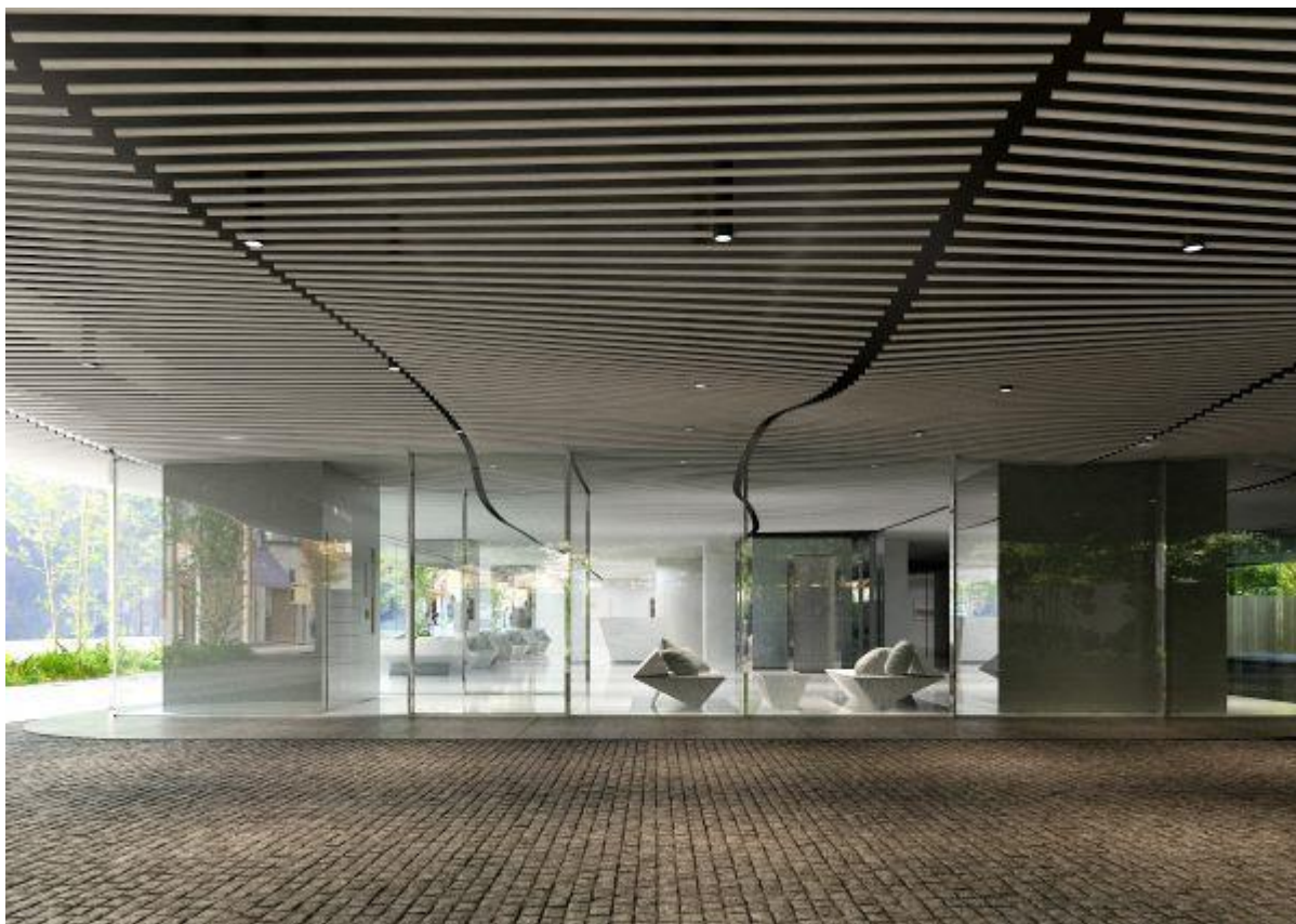
【エントランスロビー】