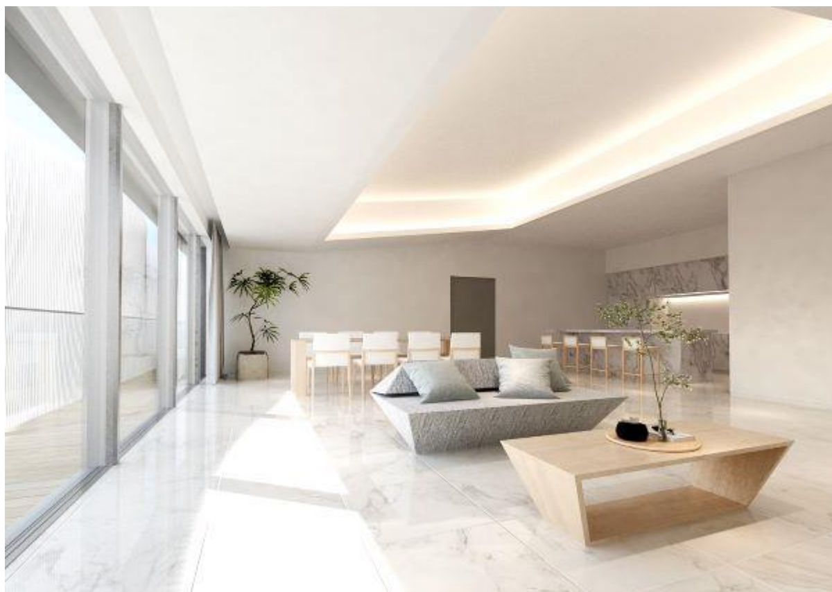
【Room Type 大理石】