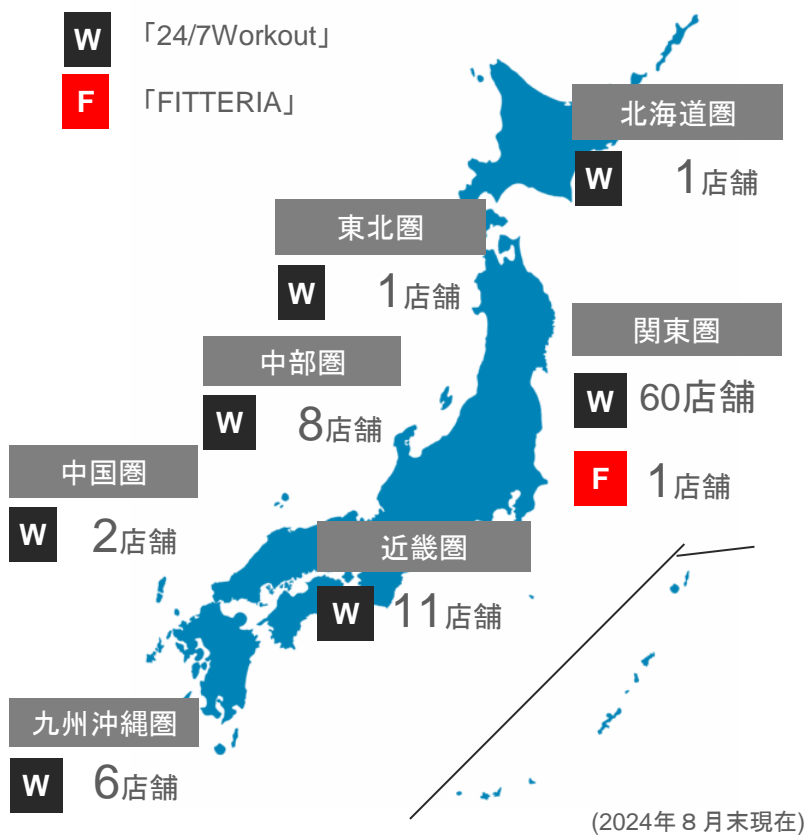
現在の地域別国内店舗網