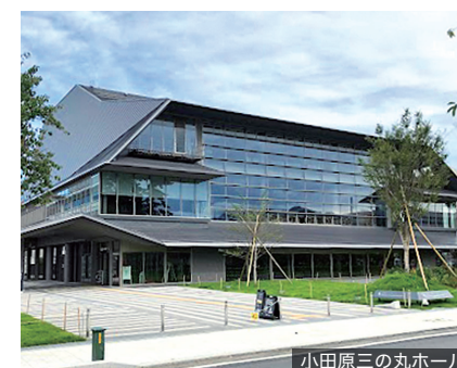
小田原三の丸ホール

地域の祭りや商店街イベント、行政や団体・民間主催の各種講演会などの身近な事業から、移住促進、各種コンサルタント、主権者教育の推進、都市計画事業への参画まで、「まちおこし」や「まちづくり」に資する各種事業を積極的に促進するとともにその収益化を図ります。