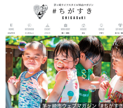
茅ヶ崎市ウェブマガジン「#ちがすき」