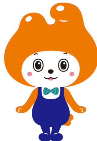
amipull©青森みちのく銀行