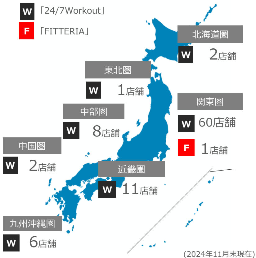
現在の地域別国内店舗網