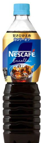
ネスレ ネスカフェエクセラ甘さ控えめ /1本 参考価格 ¥186 セール価格¥140(税込) 25%OFF