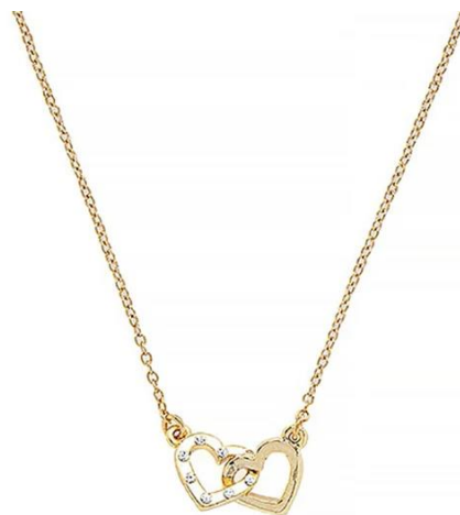
ダブルハートプチネックレス (ニッケルフリー) ゴールド / 187-49002 通常価格¥3,850(税込)