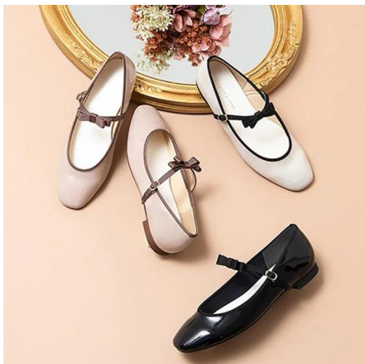
2WAY ダブルリボンストラップ エナメルパンプス 通常価格¥9,460(税込)