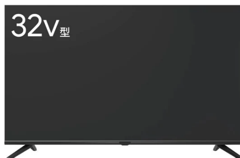
GREEN HOUSE 32V型 Google 液晶テレビ チューナーレス GH-GTVM32B-BK 通常価格¥18,900(税込)